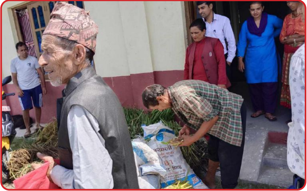
नगरपालिका अन्तर्गत विभिन्न वडाका किसानहरूलाई विभिन्न १२ जातको घाँसको विड वितरण