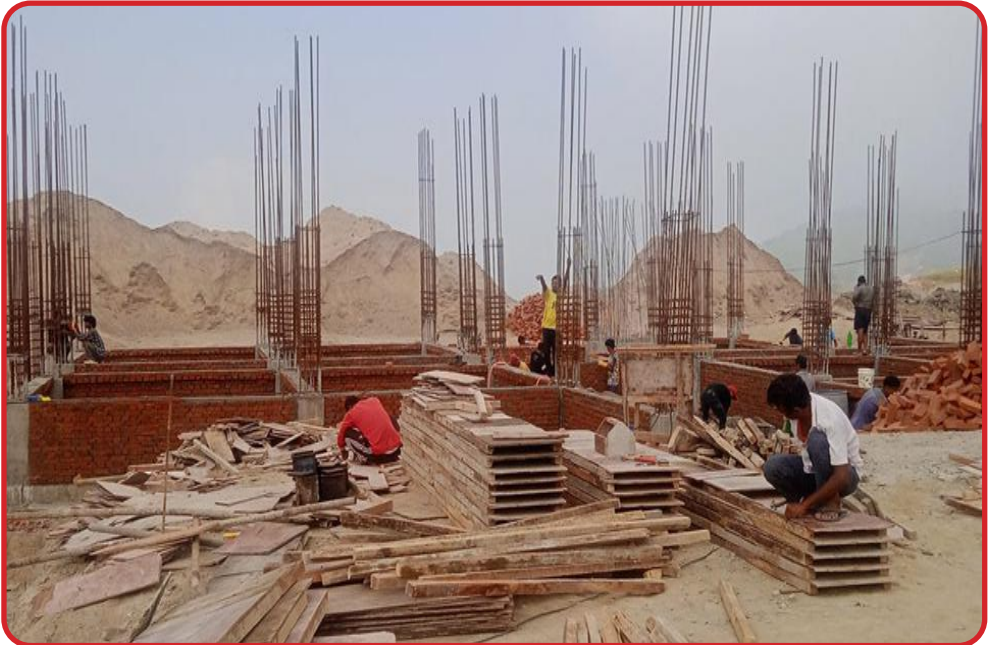
बेलकोटगढी नगर पालिकाको निर्माणाधिन मुख्य प्रशासकीय भवन ।