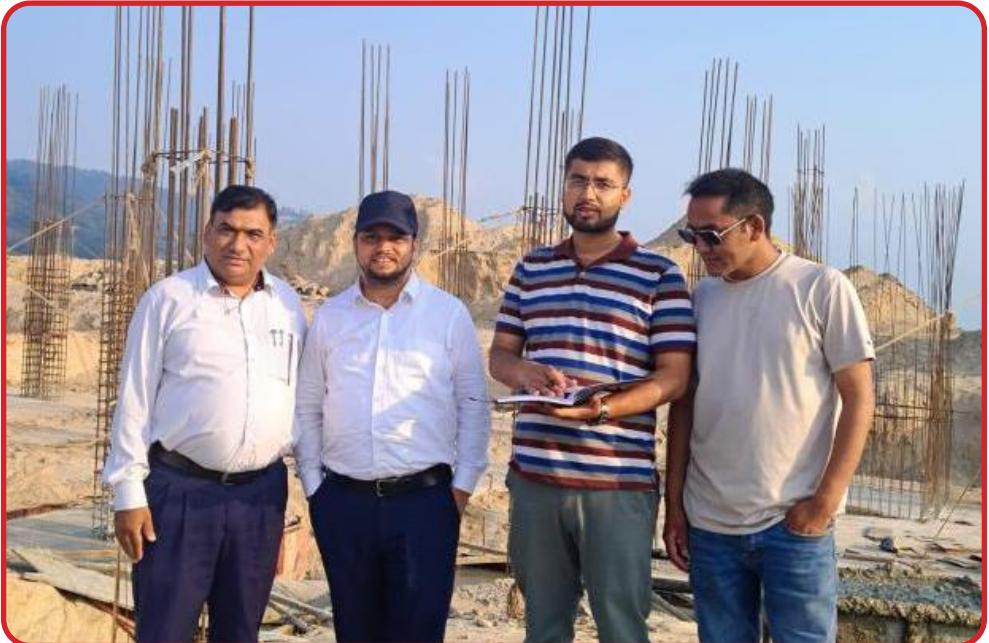
प्रमुख प्रशासकीय अधिकृत सहितको समुहबाट मुख्य प्रशासकीय भवन निरिक्षण पश्चातको सामुहिक तस्विर