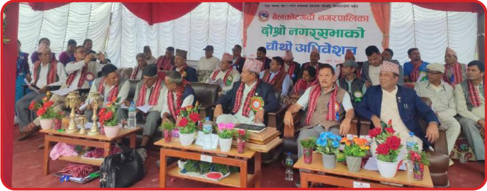
दोस्रो नगर सभाको चौथो अधिवेशन ।