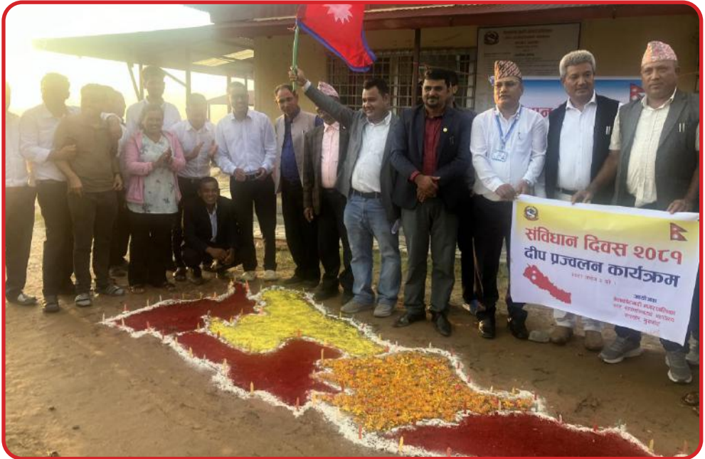
संविधान दिवस २०८१ कार्यालय परीसरमा दिप प्रज्वलन कार्यक्रम