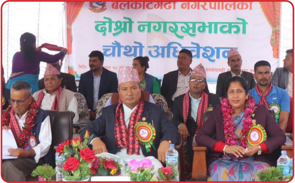
बेलकोटगढी नगर पालिकाकोदोस्रो नगर सभाको तेस्रो अधिवेशनका प्रमुख अतिथीहरू ।